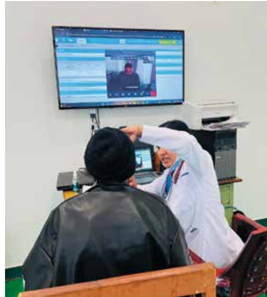
Konsultation in einem Gesundheitsposten

Die wachsende Bedeutung der Telemedizin zeigt sich auch in Ländern mit hohem Einkommen. So setzt beispielsweise die Schweiz mit Gesundheitsausgaben von 8.049 USD pro Kopf (11,3 % des BIP; OECD, 2023) zu-